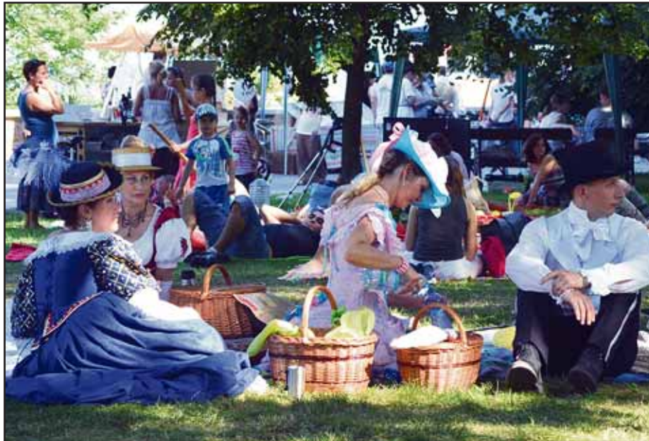
Na Hrade bolo v sobotu plno, piknikovali tu mladí aj starí Prešporáci.