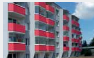
Dokončená realizácia prístavených lodžií (vrátane bytov, kde predtým balkóny neboli)