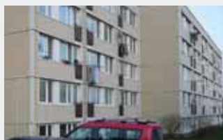
Pôvodný stav bytového domu - francúzske okná bez balkónov