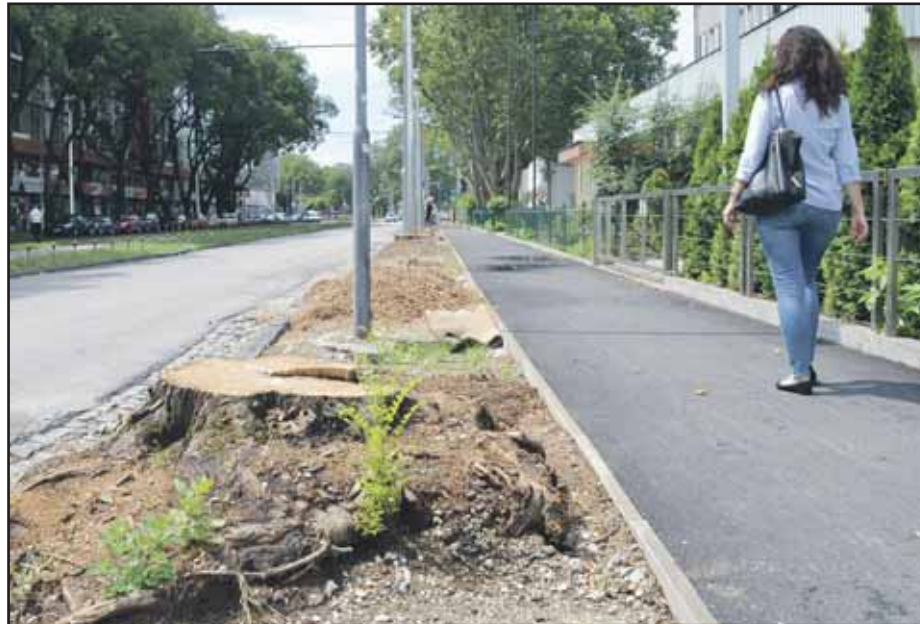
Stĺpom trolejového vedenia muselo na Trenčianskej ulici ustúpiť 21 stromov.

V ostatných mestských častiach sa o menách kandidátov zatiaľ nehovorí, zrejme však budú kandidovať súčasní starostovia. (brn)