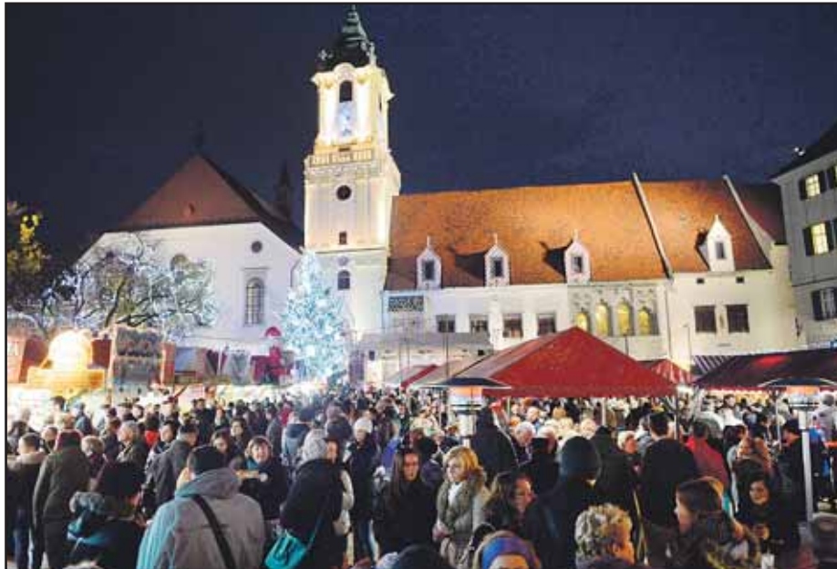
Ak neprší, na vianočných trhoch je tradične plno ľudí.

Zostáva veriť, že modernizácie ďalších tratí budú okrem technického riešenia zohľadňovať aj záujmy cestujúcich. (pol)