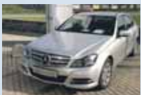
C 220 CDI BlueEfficiency metaliza strieborná, 7 st. automat 7/2012, 33 553 km 32 500 €