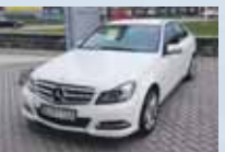
C 180 CDI BlueEfficiency lak biely, 7 st. automat 8/2012, 25 262 km 25 500 €