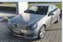
C 220 CDI BlueEfficiency metaliza strieborná, 7 st. automat neprihásené, 18 159 km 32 500 €