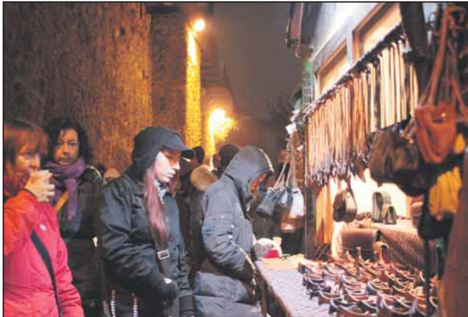
Vianočné trhy na hradbách po roku opäť lákajú Bratislavčanov.

Starý most v Bratislave začali rozoberať 2. decembra 2013. Električková trať do Petržalky mala byť dokončená koncom augusta 2015, nový termín dokončenia je 31. októbra 2015. (brn)