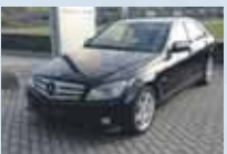
C 220 CDI BlueEfficiency lak čierny, 5 st. automat 7/2008, 137 778 km 19 900 €