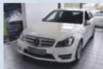
C 220 CDI BlueEfficiency lak biely, 7 st. automat 10/2013, 15 674 km 34 900 €