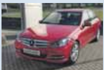
C 200 CDI BlueEfficiency lak červený, automat 7/2012, 20 157 km 28 500 €