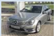
C 200 CDI BlueEfficiency metaliza strieborná, 7 st. automat 7/2013, 20 116 km 28 900 €