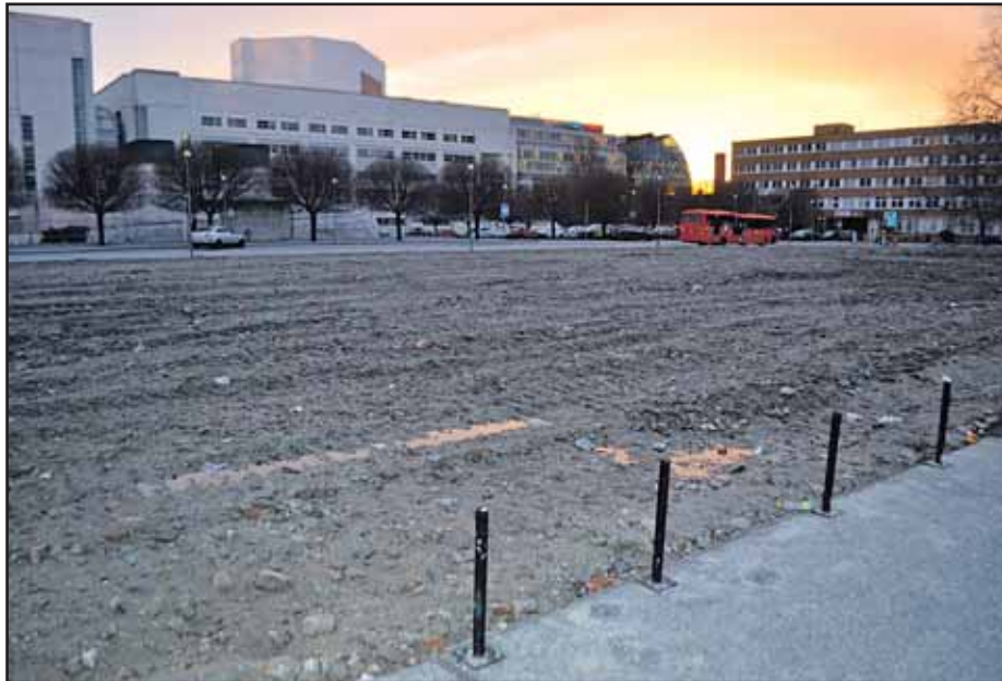
Ohraničený pozemok pri SND je už prázdny.

Najbližšie bude hostiť svetovú hokejovú elitu Česko (v máji tohto roku Praha a Ostrava), na budúci rok sa MS uskutočnia v ruských mestách Moskva a Petrohrad, v roku 2017 v nemeckom Kolíne a francúzskom Paríži, v máji 2018 sa najlepšie svetové výbery predstavia v Kodani a Herningu. (mm)