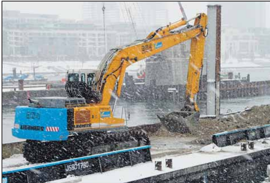
Práce na moste sa nezastavili ani počas pondelkovej chumelice.