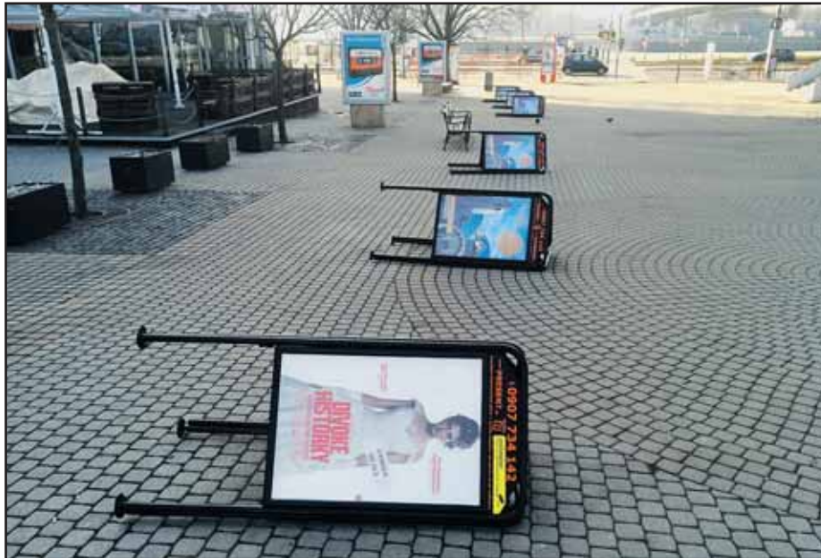
Po minulom víkende skončili niektoré reklamné trojnožky na zemi.

Vážna situácia je najmä v mestskej doprave. V posledných rokoch sa vo veľkom nakupovali nové vozidlá, ktoré síce budú z vyše 80 percent zaplatené z eurofondov, ale mesto nemá ani na uhradenie zvyšnej sumy. Rozpočet ohrozuje aj meškanie výstavby nového Starého mosta. Ak sa mesto nemá dostať do nútej správy, musí šetriť. „Začínam od seba, nebudem si valorizovať plat. Poslanci síce majú nárok na odmeny, ale vyzývam ich, aby si ich vzhľadom na situáciu nevyplatili,“ bil na poplach primátor. Podľa neho sa nebude škrtiť v kultúre, v športe a v sociálnej oblasti. Prudko sa však znížia výdavky na propagáciu mesta a marketing. „Najlepším marketingom je čisté mesto,“ vysvetlil I. Nesrovnal zámer zdvojnásobiť výdavky na čistenie mesta. (jak)