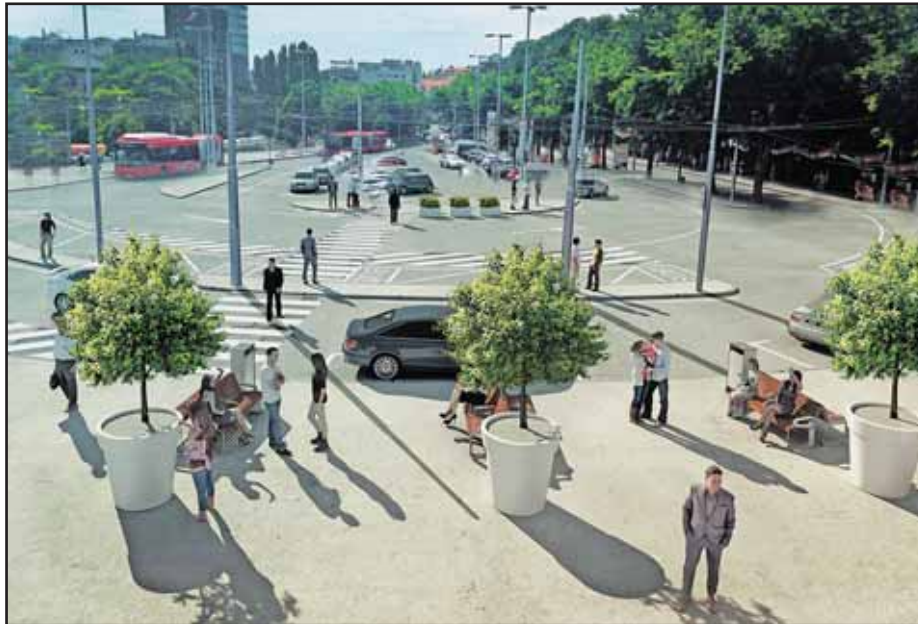
Priestor pred stanicou má byť voľnejší a upravenejší.

ŠK Slovan Bratislava spustil od pondelka 29. júna online predaj permanentných vstupeniiek na sezónu 2015/2016. Osobný predaj na sekretariáte klubu sa začal 30. júna. Majiteľ permanentky automaticky získava rôzne výhody a benefity. Permanentná vstupenka je napríklad platná na všetky domáce zápasy Fortuna ligy a Slovnaf Cup-u. Pri porovnaní cien vstupeniiek a permanentky získava majiteľ permanentky až 6 domácich ligových zápasov zdarma. Držiteľ permanentky navyše dostane zadarmo Klubovú kartu s množstvami výhod a môže sa tešiť na darček od ŠK Slovan. Okrem toho má predkupné právo na svoje miesto na zápasy európskych súťaží (ak to pravidlá a podmienky UEFA budú umožňovať) a každý majiteľ permanentnej vstupenky bude mať svoje sedadlo vyznačené nálepkou. (db)