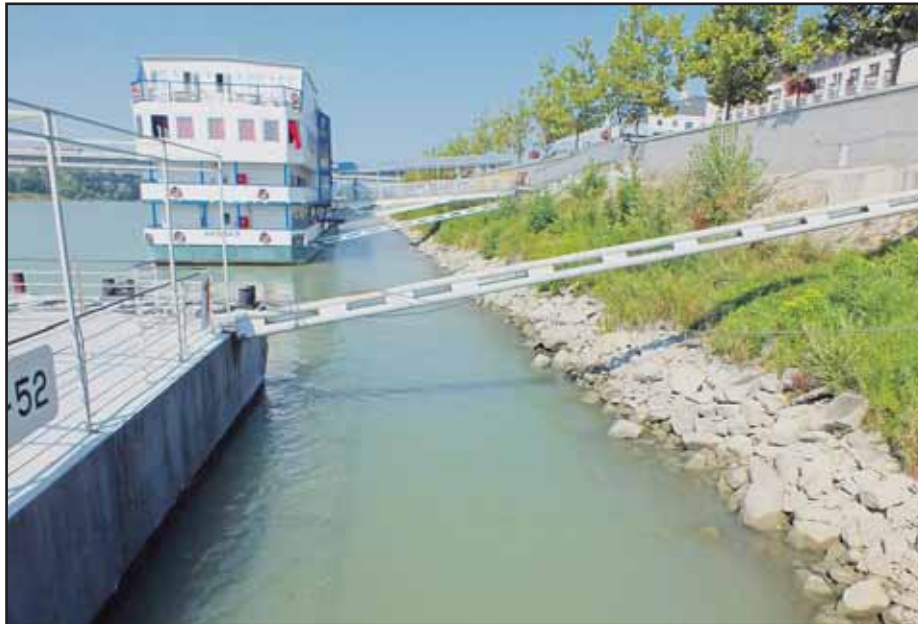
Hladina Dunaja poriadne klesla, ale vodnú dopravu to nemá ovplyvniť.

Oceľová konštrukcia nového Starého mosta sa už nebude vysúvať iba z petržalskej strany. Práce na konštrukcii sa presunuli aj na staromestskú stranu. Na ľavom brehu Dunaja sa aktuálne montuje 30-metrový segment konštrukcie. Pôvodne sa mala vysúvať oceľová konštrukcia z petržalskej strany teraz, postup prác sa však zmenil pre deformácie ohrádzky spôsobenej vyššou hladinou Dunaja pri mikropilotáži. Po zabetónovaní piliera sa na petržalskej strane vysunie až 70 m konštrukcie. Spoločne so staromestskou časťou tak bude mať už asi 300 zo 460 metrov. (db)