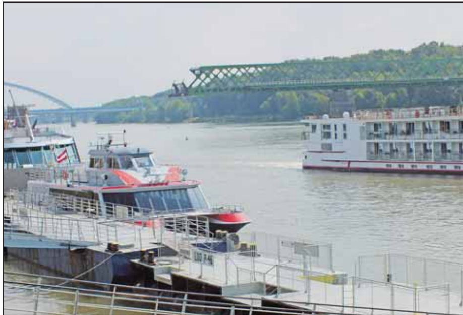
Práce na moste zastavia plavbu po Dunaji.