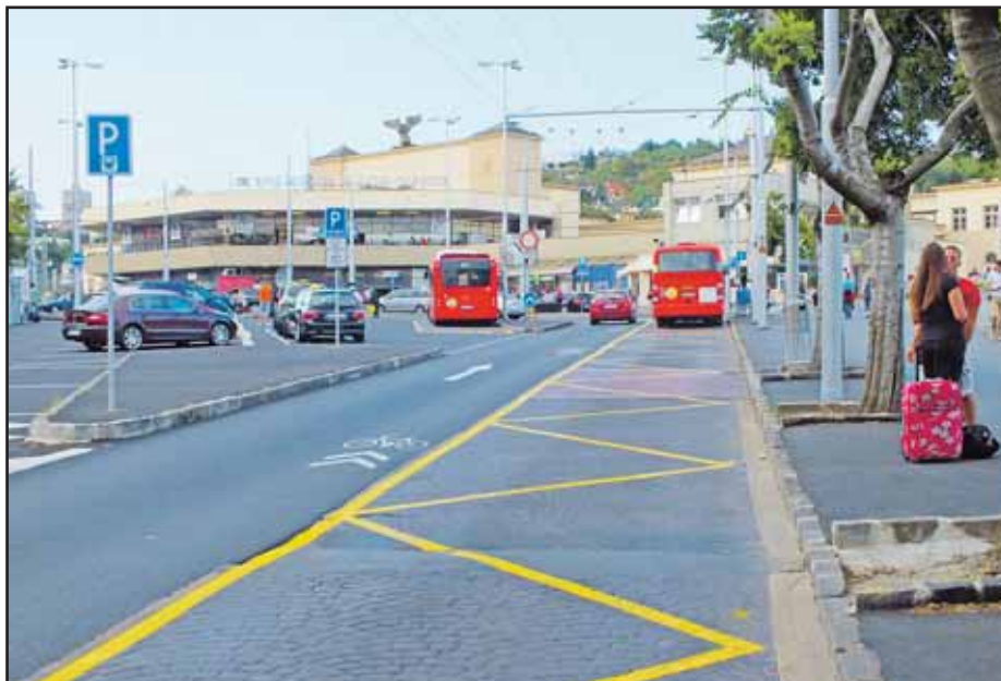
Chodníky a cesta pred hlavnou stanicou majú nové koberce.

Okrem zmeny štatútu si zavedenie jednotných pravidiel vyžiada aj prijatie celomestského nariadenia o dočasnom parkovaní motorových vozidiel na miestnych komunikáciách. (brn)