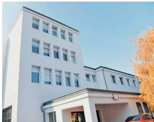
Školy na Hálovej a Kvačalovej ulici vyzerajú po opláštení omnoho atraktívnejšie.

ktorý je iniciatívou Európskej banky pre obnovu a rozvoj a Európskej komisie na podporu samospráv pri projektoch energetickej efektívnosti na Slovensku.