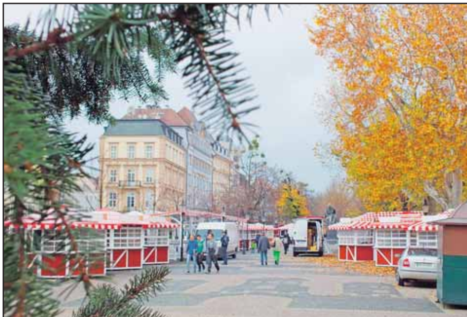
Na Hviezdoslavovom námestí budú mať trhy väčší priestor a viac stánkov.

„Po novom je možné prepravovať bicykle v MHD v pracovných dňoch v čase od 9.00 do 13.00 h a v čase od 18.00 h do 6.00, počas sobôt, nedeľ a sviatkov bez časového obmedzenia. Prepravovať bicykel je však možné len so súhlasom vodiča, ktorý vyhodnotí obsadenie vozidla. Súčasne treba dať prednosť cestujúcim na invalidnom vozíčku alebo s detským kočíkom. Zložený skladací bicykel sa považuje za batožinu. Súčasne zostáva možnosť prepravy bicyklov v spojach ZSSK, ako aj na regionálnych autobusových linkách Slovak Lines počas víkendov a sviatkov v spojach, ktoré sú v cestovnom poriadku označené piktogramom bicykla,“ informovala Kristína Marošová z Ministerstva dopravy, výstavby a regionálneho rozvoja SR. Informáciu by mal svojim vodičom oznámiť aj dopravný podnik. Aj minulý týždeň sa našli vodiči, ktorí neboli o zmene informovaní a bicykle do poloprázdných spojov nepustili... (db)