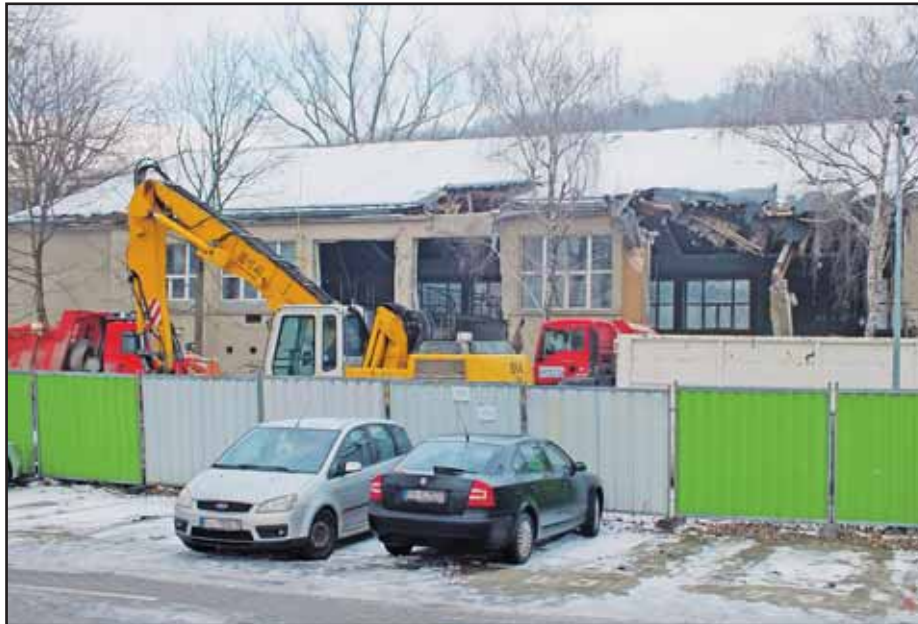
PKO začína miznúť, ťažké stroje búrajú obe hlavné sály.

„Ešte koncom decembra električka odskúšala zjazdovosť úseku okruhu Vajanského - Štúrova - Jenesského. Keďže ide o ucelený okruh, skúška sa konala najskôr na tomto úseku, lebo ako samostatnú ucelenú časť ju chceme aj kolaudovať,“ informovala hovorkyňa magistrátu Ivana Skokanová. Podľa jej slov, „ďalšia skúška na moste na obidva rozchody 1000 mm a 1435 mm bude koncom januára 2016, po dynamických skúškach mostného objektu, a vykoná ju bratislavský dopravný podnik. Na moste tak bude skúška na obidva rozchody súčasne. V rovnakom čase sa vyskúša aj širší rozchod na Štúrovej ulici, čo je ďalší objekt, resp. časť, ktorá sa bude kolaudovať samostatne.“ Čo sa týka termínov otvorenia Štúrovej ulice či mosta, presné dátumy zatiaľ nepadli. „Štúrova ulica bude sprepriaznená až po kolaudácii a potom budú po nej premávať aj električky. Stane sa tak v najbližších dňoch. Bližšie termíny však nemožno povedať, pretože kolaudácia sa týka mesta, BSK, Starého Mesta, Petržalky a okresného úradu,“ dodala I. Skokanová. (db)