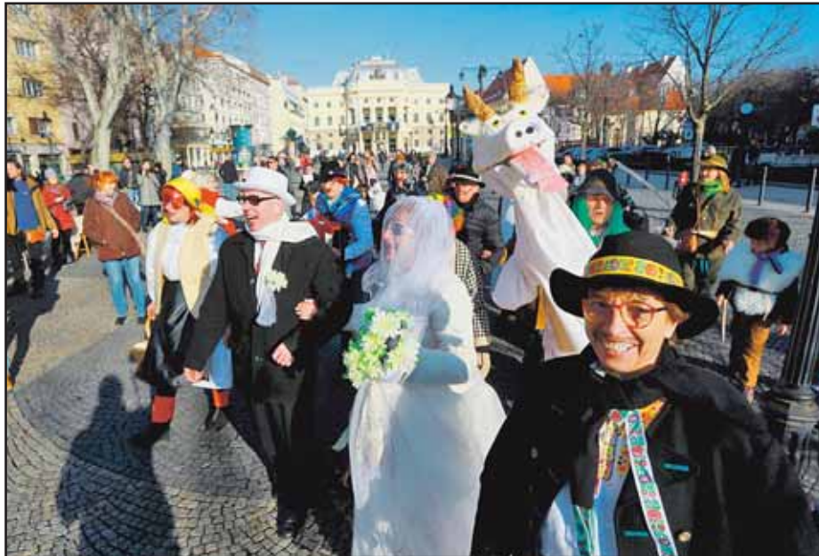
Bratislavčania si cez víkend pripomenuli, ako sa počas fašiangov kedysi bavilo.

V druhej časti trate dlhej približne 4,3 km bude sedem zastávok: Chorvátske rameno (dnes približne zastávka Jungmannova), Gessayova (nová zastávka v centre pripravovaného projektu Petržalka City), Zrkadlový háj (medzi dnešnými zastávkami Romanova a Markova), Stred (dnes zastávka Topoľčianska), Veľký Draždiak (medzi dnešnými zastávkami Šintavská a Strečnianska), Lietavská (medzi pôvodne navrhovanými zastávkami Lietavská a Juh), Janíkov dvor (pod podjazdom pod Paňónskou cestou). (db, is)