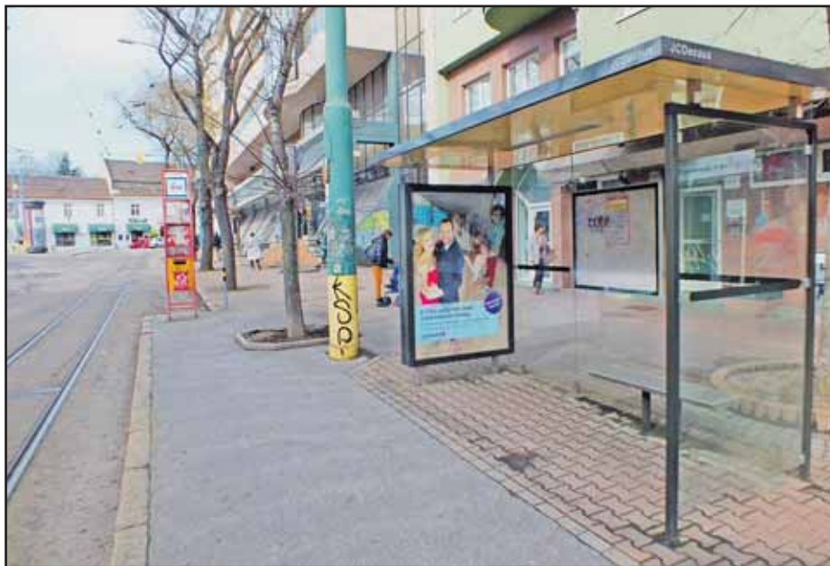
Pred zastávkou, ktorá stojí na Vazovovej ulici, už električky nezastavujú.

Pre Bratislavčanov, ktorí budú v ten deň mimo mesta, je dôležité, že volič, ktorý má trvalý pobyt na území SR a v deň konania volieb nebude môcť voliť v mieste svojho trvalého pobytu, môže požiadať obec svojho trvalého pobytu o vydanie hlasovacieho preukazu. Môže tak požiadať osobne alebo prostredníctvom splnomocnenej osoby, najneskôr však posledný pracovný deň pred konaním volieb v úradných hodinách obce (4. marca). (db)