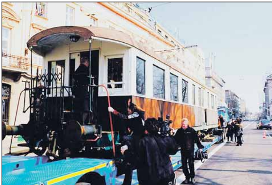
Po 81 rokoch sa vagón Viedenskej električky vrátil na Vajanského nábrežie.

Predstavitelia mestskej časti diskutovali o budúcnosti Šafka aj s obyvateľmi, ktorí tu žijú a výsledky debaty sa mali premietnuť aj do jednotlivých návrhov v súťaži. (brn)