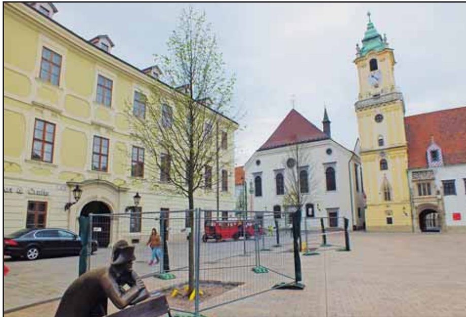
Na štyroch nových stromoch sa objavili už aj prvé listy.

Zoznam zverejnil Mestský ústav ochrany pamiatok v Bratislave. Celkove je v ňom už tristo pamätihodností, ktoré pripomínajú históriu Bratislavy. Pred tromi rokmi sa do zoznamu dostali napríklad fontána svätého Juraja na Primaciálnom námestí, pomník obetiam rasizmu a neonacizmu na Tyršovom nábreží či Biely kríž na Námestí Biely kríž v Novom Meste či Červený kríž v Starom Meste. (brn)