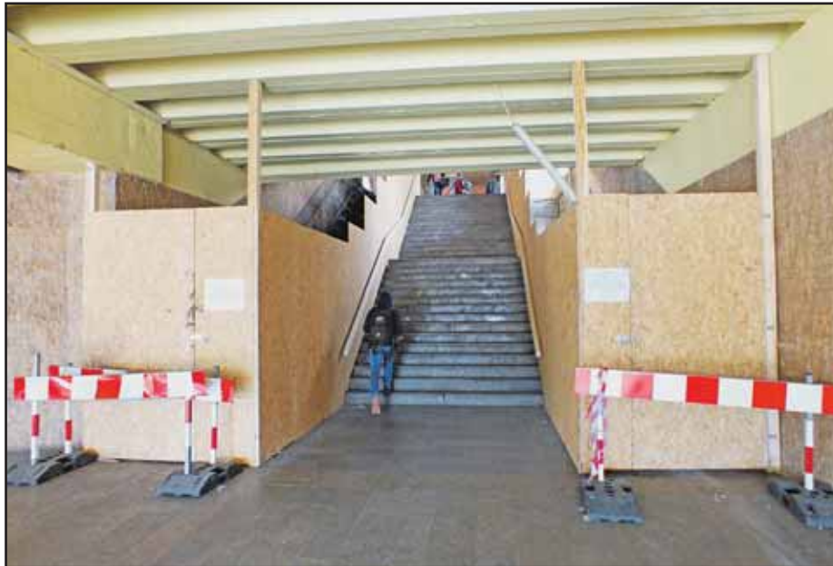
Cestujúci na Hlavnú stanicu sa do konca júna dočkajú nových eskalátorov.

S kolaudáciu električkovej dráhy začala už aj Bratislavská župa. Keď pôjde všetko podľa plánu, po splnení zákonných lehôt by prví cestujúci mohli prejsť električkou cez most v polovici júla. Kolaudačné rozhodnutie bude na skúšobnú prevádzku, ktorá môže trvať maximálne jeden kalendárny rok. (db)