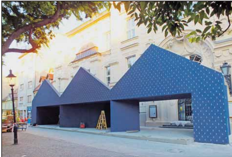
Viacere ulice v centre vyzerajú inak ako pred pár týždňami...

Linka č. 1 ide teraz z hlavnej stanice cez Radlinského, Obchodnú, tunel a Vajanského nábrežie späť na hlavnú stanicu. Linka č. 4 ide z Dúbravky cez Vajanského nábrežie na Kamenné námestie, Zlaté piesky a späť cez Trnavské mýto, Špitálsku a tunel do Dúbravky. Linka č. 6 ide z Karlovej Vsi na nábrežie arm. generála L. Svobodu pod Most SNP. V priestore zastávky Most SNP sa navyše zriadi manipulačná výhybka, aby sa obojsmerné električky linky č. 6 mohli „otáčať“, čím sa zabezpečí obojsmerné spojenie Mosta SNP s karloveskou radiálou. Pre cestujúcich pribudne ešte náhradná autobusová zastávka Námestie L. Štúra. Bude pre linky č. 28, 70 a 95, ktoré dočasne zastavujú na tejto náhradnej zastávke - pred SNG v smere k Mostu SNP.