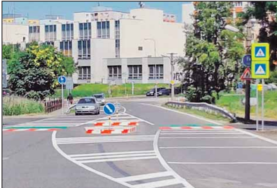
Priechod umožní bezpečnejší prechod cez frekventovanú cestu.

Krajský súd uznesením potvrdil právoplatnosť využívania SeniorPasu ako elektronického predplatného časového cestovného lístka, vydávaného výlučne na bezkontaktné čipovej karte. Tento lístok sa vydáva za hodnotu 0 €. Platí sa len poplatok za vydanie karty. Ak cestujúci nad 70 rokov nemá alebo nechce používať SeniorPas, môže od augusta cestovať na polovičný jednorazový cestovný lístok (zľava 50 percent). (ek)