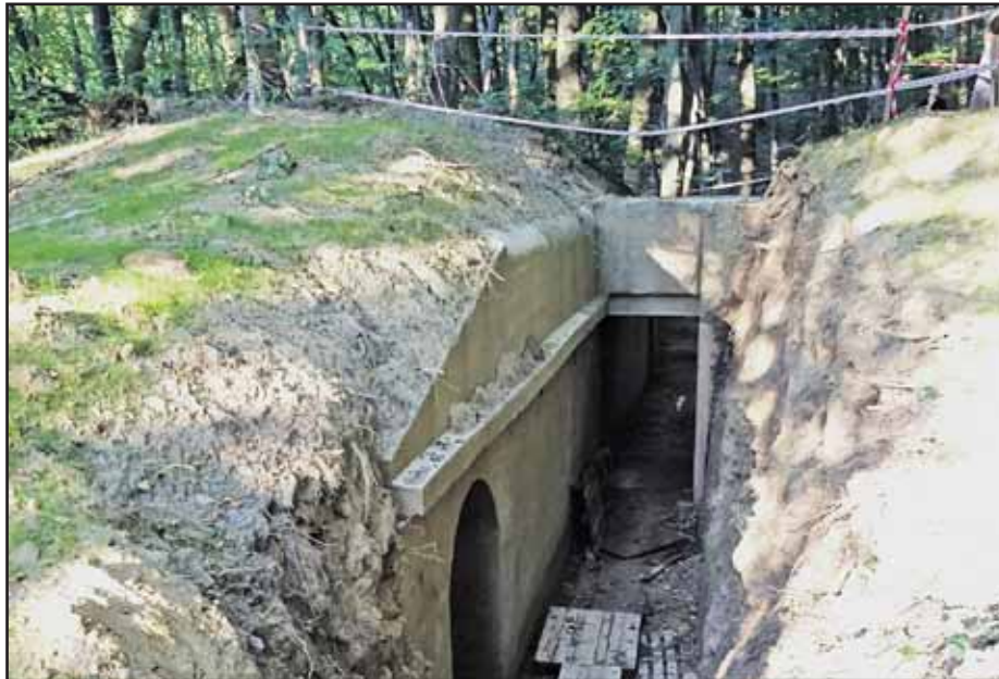
Bunker pomaly dostáva podobu, akú mal po postavení.

Časť zábradlí, ktoré odsúhlasil Krajský dopravný inšpektorát, natierajú na sivo (približne 8 kilometrov), druhá časť (asi 14 kilometrov) sa natiera na červeno-bielo pre bezpečnosť cestnej premávky. V rovnakom čase začali odstraňovať aj zábradlia, ktoré boli zbytočné a znehodnocovali vzhľad verejných priestorov - napríklad z Bajkalskej ulice, Vazovovej, Búdkovej, Botanickej, Tomášikovej, zo Šustekovej, z Jégeho, Námestia hraničiarov či z Nábřežia armádného generála L. Svobodu. Úplne nové sivé vymenené zábradlie je napríklad na Patrónke. Obnova zábradlí potrvá do konca októbra. (kk)