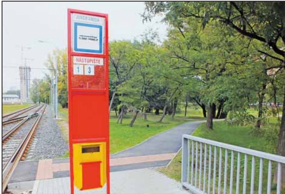
Chodník zo zastávky Jungmannova stále čaká na osvetlenie.

■ Linka č. 8 pôjde cez Záhradníckú, Miletičovu, Krížnu, Vazovovu, Blumentál, Obchodnú, Nám. SNP, Jesenského, Mostovú, Nám. L. Štúra, Vajanského nábr., Šafárikovo nám., Štúrovu, Nám. SNP, Obchodnú, Radlinského, Blumentál, Vazovovu, Krížnu, Miletičovu, Záhradnícku, Ružinovskú späť do Ružinova. (mm)