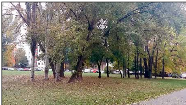
Na tejto trávnej ploche, pred domom dôchodcov na Poloreckého ulici, by mal stáť nový nájomný dom.

Dnes už je jasné, že náhradné nájomné byty hlavné mesto do konca roka nezoženie, hoci lokality na výstavbu nájomných bytov zúfalo potrebuje. „Aktuálne je vydané právoplatné stavebné povolenie na výstavbu v lokalite Pri križi v mestskej časti Dúbravka, kde by sa výstavba mohla začať ešte v priebehu tohto roka. Ďalšia lokalita, ktorá je už v procese verejného obstarávania, je Na vrátkach, taktiež v Dúbravke,“ informuje stránka bratislava.sk. V procese prípravy sú však aj projekty v ďalších lokalitách ako Mamateyova a Haanova v mestskej časti Petržalka, Borodáčova v mestskej časti Ružinov či Istrijská v Devínskej Novej Vsi.“