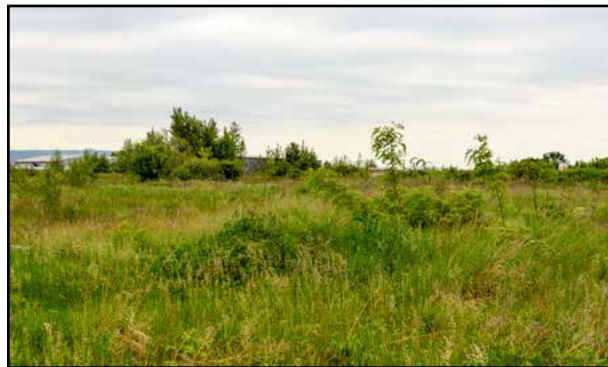
Na prvý pohľad pôsobí toxická skládka nevinné.

V priebehu novembra sa na pôde Bratislavskej župy