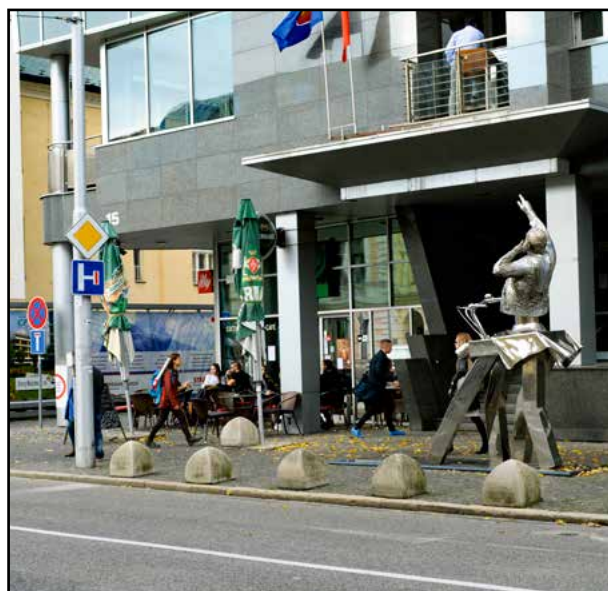
Dopravná značka informuje, že Satinského ulica je slepá. Pritom podľa územného plánu mala byť prejazdna.